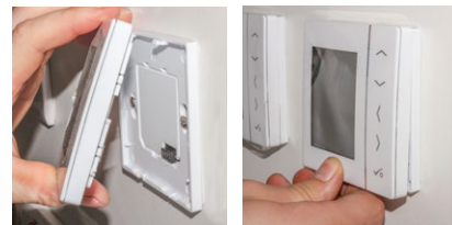
Con base de enchufe para minimizar el impacto visual.

Diseñado para el control de la temperatura ambiente en calefacción y en refrescamiento. Incluye cronotermostatos con alimentación a 230V (sin necesidad de pilas) de atractivo aspecto visual con pantalla LCD de gran formato retroiluminada en color azul. Con posibilidad de configurar pro-